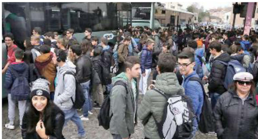
Si temono mezzi sovraffollati con la riapertura delle scuole

I Comuni temono che la riorganizzazione dei bus della zona confinante penalizzi da settembre gli studenti per affollamento, orari e tariffe diverse